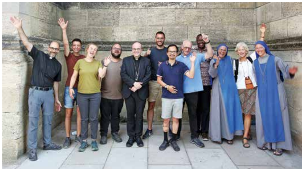
De deelgropleiders van de WJD-reis van het bisdom.

De Kerk bruist tijdens de WJD en wat zou het mooi zijn als we dat thuis volhouden en voortzetten. Jongeren zijn niet alleen de toekomst van de Kerk, maar ook het heden en onderdeel van de Kerk. Ze kunnen hun steentje bijdragen. En niet zozeer omdat er mensen nodig zijn om de klus te klaren, maar omdat de Kerk een levend organisme is, waar iedereen zijn of haar steentje bijdraagt. ■