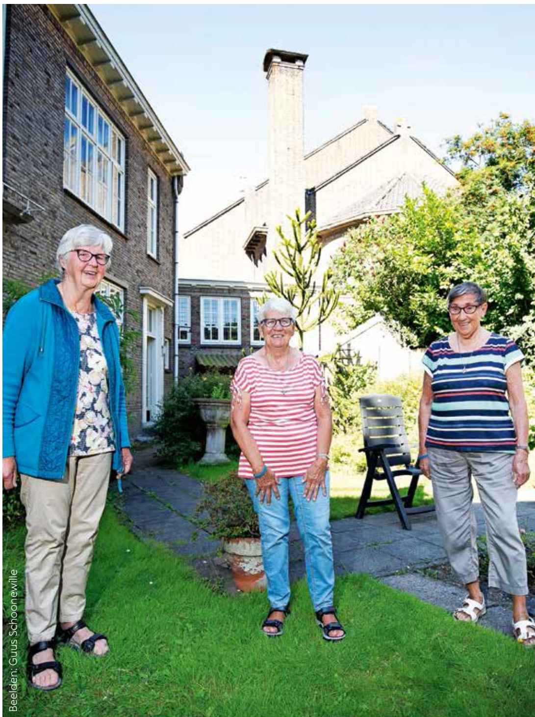
Beelden: Guus Schoonewille

Waarom is het belangrijk om als zusters mee te werken aan de liturgie? “We zijn dominicanessen en dat betekent: verkondiging”, zegt zuster Delia. De twee anderen vallen haar bij en geven Delia een compliment voor haar overwegingen.