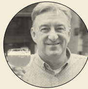
Door Fedor Vogel

Na 75 jaar krijgen de bieren van Westvleteren een etiket.