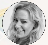
Door Celine Timmerman

In deze rubriek wandelen we door een stad, dorp of regio waarbij we beschrijven hoe de parochie aanwezig én zichtbaar is. Welke nog onontdekte bijzonderheden zijn er in deze plaats en kerken? Wij zoeken het uit. Deze keer: Dordrecht