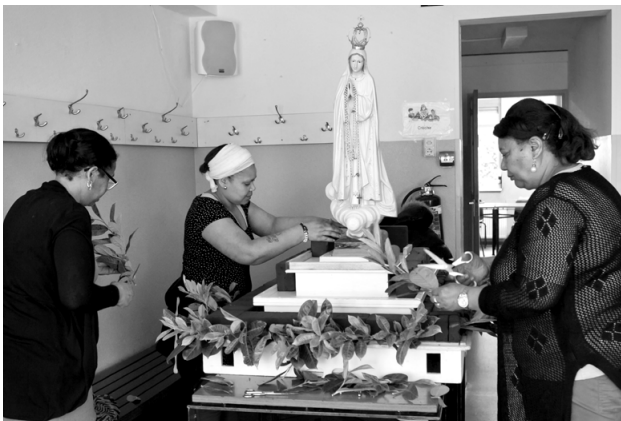
Projectentocht. Bezoek Portugeessprekende parochie.

Twee migrantenparochies in de stad Rotterdam tonen op 13 mei 2017 hun diaconale gezicht aan de deelnemers van de jaarlijkse Projectentocht van de Diocesane Caritasinstelling en het bisdom Rotterdam. 's Ochtends worden de deelnemers gastvrij ontvangen door de vrijwilligers van de stichting Nuestra Casa, die gelieerd is aan de Spaanssprekende parochie. In de Rotterdamse regio leven zo'n 12.000 Spaanssprekende mensen. Nuestra Casa wil hen effectief de weg wijzen in de Nederlandse samenleving, met name de nieuwkomers. 's Middags bezoekt de Projectentocht in Delfshaven de Portugeessprekende parochie. Een op de tien bewoners van deze deelgemeente is afkomstig uit Kaapverdië. Veel mensen werken in laagbetaalde banen. Het opleidingsniveau van de tweede en de derde generatie stijgt. Hoewel de band met Kaapverdië sterk is, zien met name de jongeren hun toekomst hier liggen. Zij zeggen: "We zijn Kaas-verdianen."