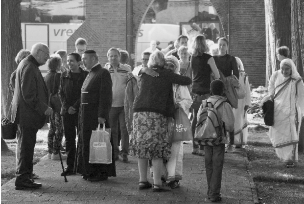
Nationale Bedevaart. Aankomst en ontvangst pelgrims.

die Brielle bezoeken. Vanwege het 150-jarig jubileum van de heiligverklaring is ook een gebedsprentje gemaakt.