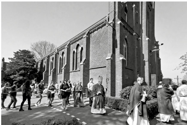
Viering diocesane Wereldjongerendag. Processie.

van de middag zijn er workshops rondom Maria, de rozenkrans, koken en zingen, en over Onze Lieve Vrouw van Waddinxveen.