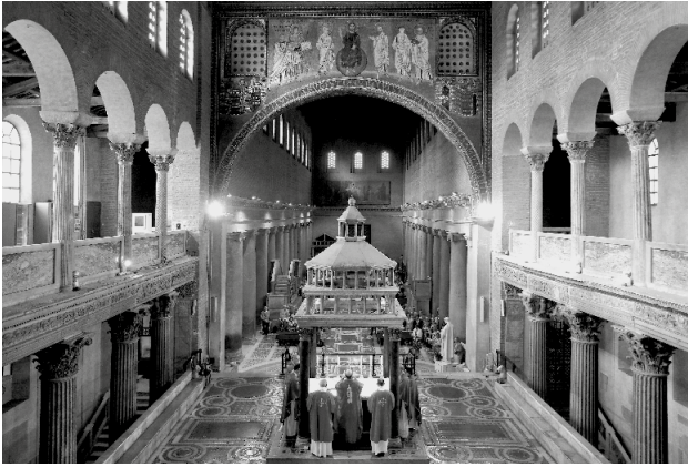
Romebedevaart. Viering in basiliek van Sint-Laurentius buiten de Muren.