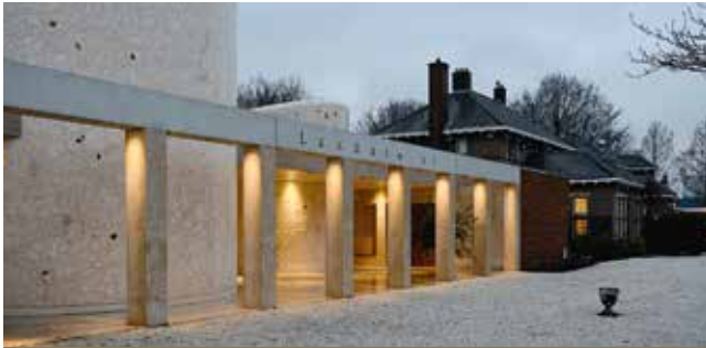
▲ Crematorium PAX ▼ Koffiekamer op begraafplaats St. Barbara