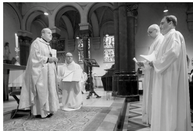
Vronesteyn. Opening van het studiejaar.