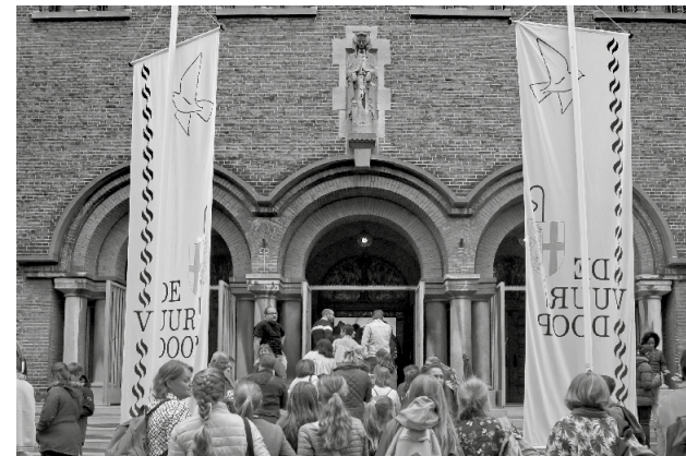
Vuurdoop. De diocesane vormelingsdag.

Op zaterdag 19 mei worden 600 vormelingen welkom geheten tijdens de Vuurdoop, op de zaterdag vóór Pinksteren. Ze beklimmen de toren van de kathedraal, maken muziek, krijgen theater en workshops die laten zien hoe de Heilige Geest je helpt om te leven vanuit je geloof. De bisschop nodigt de jongeren uit om te bidden tot de Heilige Geest: "Als je iets te doen hebt, zoals een groot examen, en zenuwachtig wordt, hoop ik dat je durft te zeggen: 'Kom, Heilige Geest.' En als je ruzie hebt gemaakt en het weer goed wilt maken, mag je bidden: 'Kom, Heilige Geest'. Het zijn maar drie woorden en je kunt ze altijd bidden." De deelnemers doorlopen het programma en komen rond het middaguur merkbaar enthousiast weer bij elkaar voor de gezamenlijke afsluiting.