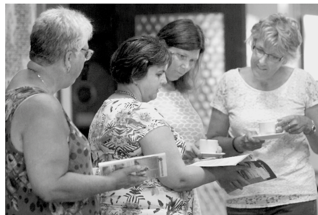
Jaar van Gebed. Parochiebladen informeren en inspireren.

Parochiebladen besteden in het Jaar van Gebed extra aandacht aan bidden. Dat blijkt tijdens de bijeenkomst met redacties van parochiebladen op 6 juni in Delft. Mgr. Van den Hende houdt een korte inleiding. Daarna gaan de redactieleden in gesprek. De parochiebladen willen mensen informeren en in toenemende mate ook inspireren. Ze kunnen lezers in de parochie helpen om tot bidden te komen. In de pauze is er met name rond de tafel met meegebrachte bladen een levendige uitwisseling.