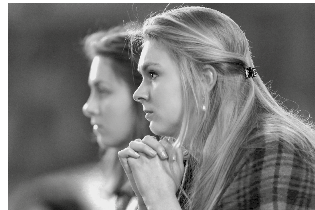
Palmzondag. De diocesane Wereldjongerendag.