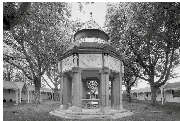
Brielle. Het ciborium op het Martelveld werd gerestaureerd.