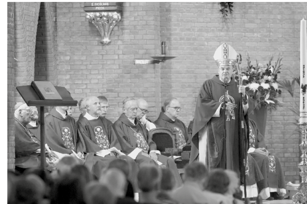
Brielle. Nationale Bedevaart.