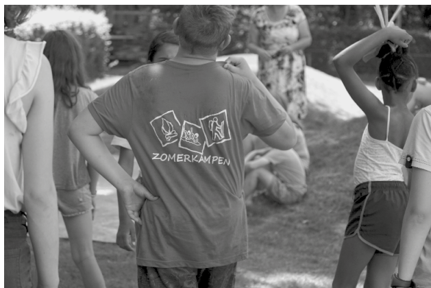
Zomerkampen. Mgr. Van den Hende bezoekt de kampen die worden georganiseerd door vrijwilligers.