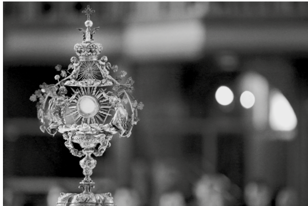
“24 uur voor de Heer”. Sacrament van verzoening.

In zijn vastenboodschap 2018 schrijft paus Franciscus: “Als de liefde in zoveel harten soms lijkt uit te doven, dan dooft zij niet uit in Gods hart! Hij geeft ons steeds nieuwe gelegenheden om opnieuw te kunnen beginnen met liefhebben.” De paus beveelt daarom in 2018 opnieuw het initiatief “24 uur voor de Heer” aan, dat ertoe uitnodigt het sacrament van verzoening te vieren in een context van eucharistische aanbidding. De “24 uur voor de Heer” is een van de activiteiten, waartoe parochies in het Jaar van Gebed in het bijzonder worden uitgenodigd.