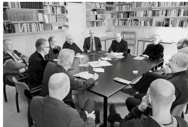
Diakenkring. Gesprek over de diaconale dimensie van het gebed.

Op dinsdag 27 februari spreekt de diakenkring met de bisschop over de diaconale dimensie van het gebed. De bisschop en de diakens ontmoeten elkaar jaarlijks in de diakenkring. Het gebed is nodig om het netwerk van liefde op te bouwen en in stand te houden. De bisschop viert met de diakens de eucharistie in de kapel van Vronesteyn.