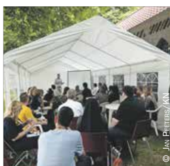
Nationale Bedevaart 4