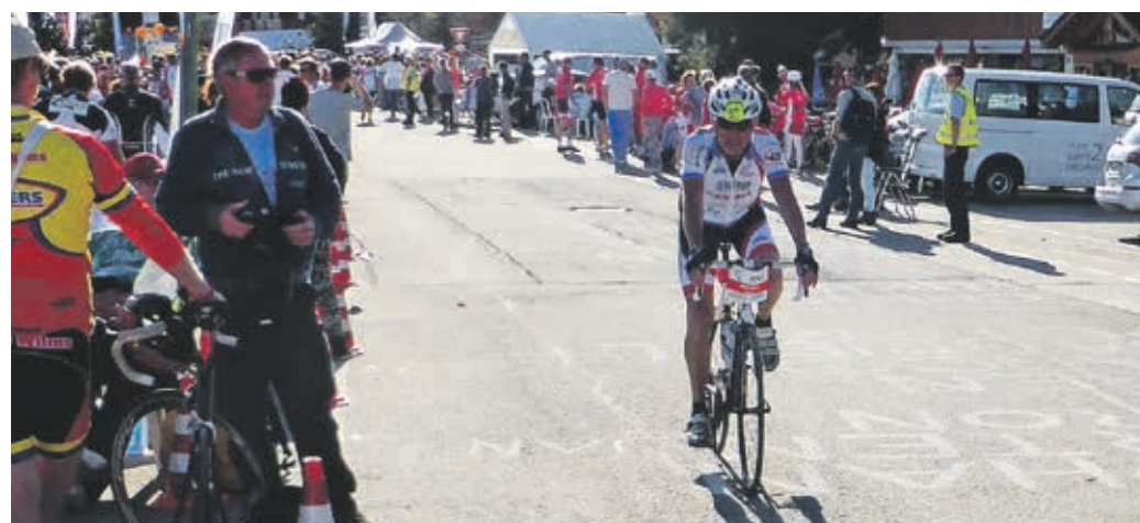
© MARIJUS DODERER, ALPE D'HUZES 2016