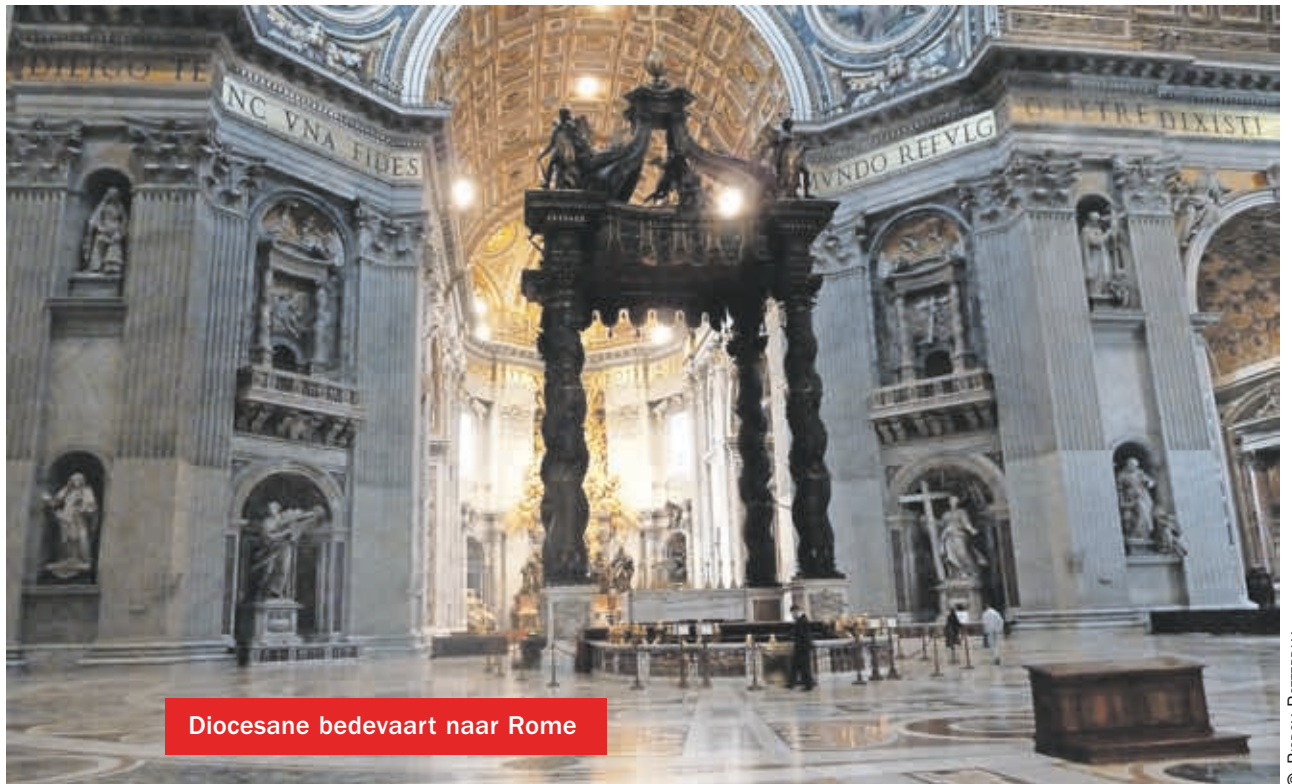
Diocesane bedevaart naar Rome

We weten ons in geloof verbonden met de wereldwijde Kerk. In deze geest komt onder meer de