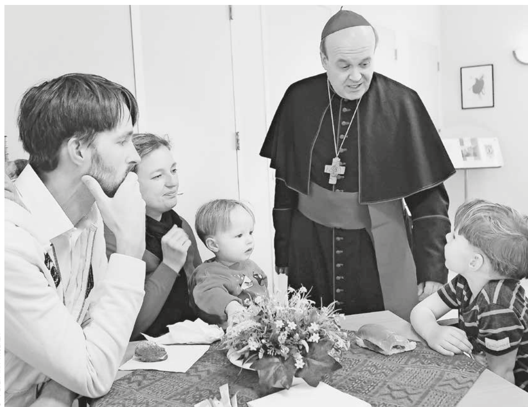
Bisschop in gesprek met het gezin van een van de kerktoetreders.