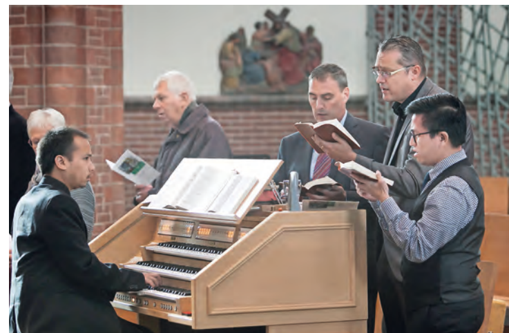
Studenten van Vronesteyn verzorgen de muzikale ondersteuning

Vronesteyn 30 jaar in ons bisdom bestaat! Vele priesters en diakens zijn op Vronesteyn gevormd en gewijd. Daar zij wij dankbaar voor. En op dit feest hoort eigenlijk een mooi cadeau. Wat zou het mooi zijn als u dat cadeau wilt geven!