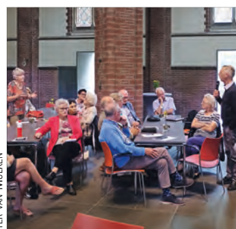
Zorg voor ouderen