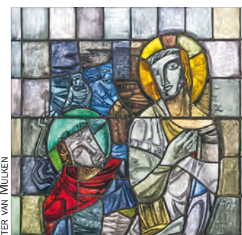
30 jaar Vronesteyn 7-10