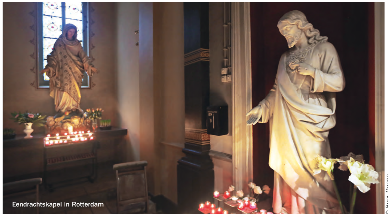
Eendrachtscapel in Rotterdam

Al biddend vormen deze intenties en vragen een lange litanie aan het adres van God, en gaandeweg raken ons denken en doen, ons spreken en verlangen steeds