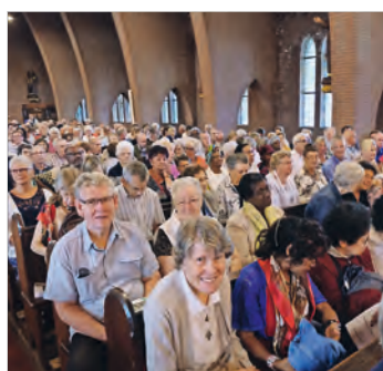
Nationale Bedevaart 4 en 5