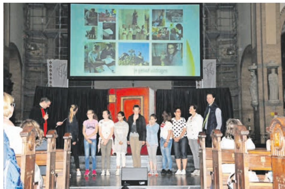
Parochie De heilige Thomas uit Alphen a/d Rijn wint de fotocollagewedstrijd