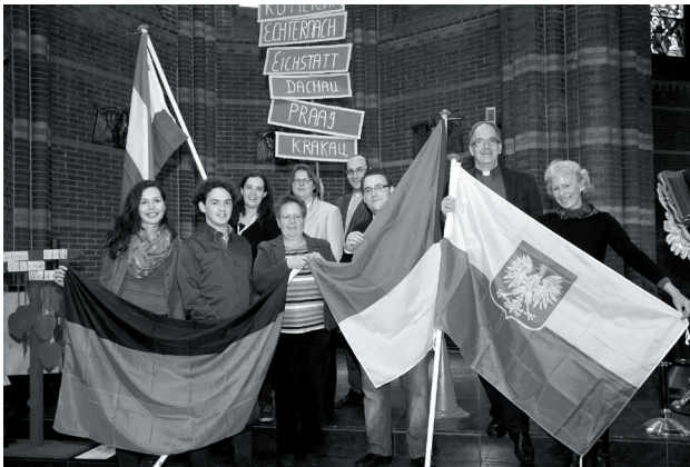
Wereldjongerendag, Op Palmzondag 2015 presenteerde de kerngroep de WJD-reis naar Polen.