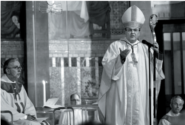
Chrismamis, Op 1 april vierde het bisdom de chrismamis.

In het evangelie dat werd gelezen wordt verteld hoe Jezus in de synagoge in Nazareth leest uit de boekrol van de profeet Jesaja: “De geest des Heren is over Mij gekomen, omdat Hij Mij gezalfd heeft. Hij heeft Mij gezonden om aan armen de blijde boodschap te brengen, aan gevangenen hun vrijlating bekend te maken en aan blinden dat zij zullen zien; om verdrukten te laten gaan in vrijheid, om een genadejaar af te kondigen van de Heer [...] ‘Het Schriftwoord dat gij zojuist gehoord hebt, is in vervulling gegaan’” (Lucas 4, 16-21).