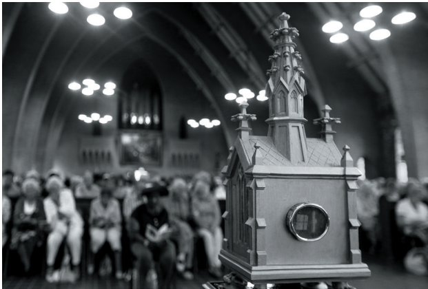
Nationale Bedevaart, De Nationale Bedevaart Brielle had als thema 'Dienstbaarheid tot in de dood'.