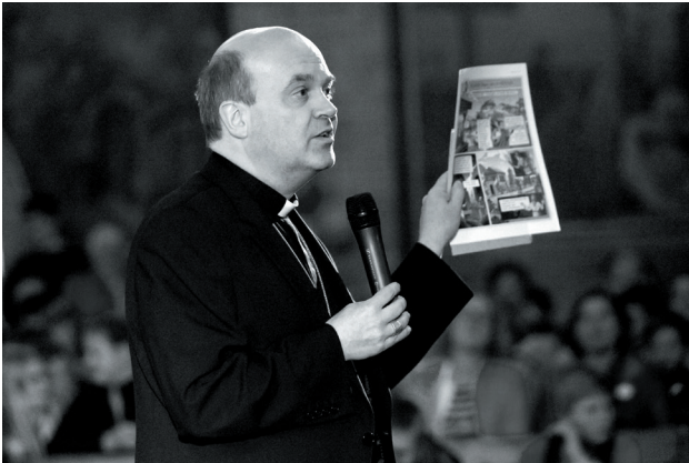
Vuurdoop, Vormelingen en hun begeleiders maakten tijdens de Vuurdoop 2015 kennis met de heilige Laurentius.

De Vuurdoop 2015 had vanwege het Laurentiusjaar speciale aandacht voor de patroonheilige van het bisdom. Tijdens geloofsgesprekken met ouders en begeleiders gingen de regiovicarissen en de bisschop met hen in gesprek over de betekenis van Laurentius. Voor de vormelingen was er een speciale workshop over de laatste dagen van Laurentius. En in onder meer de workshop M25 werd duidelijk gemaakt hoe gelovigen anno nu net als Laurentius dienstbaar kunnen zijn via de werken van barmhartigheid. Nadat ze samen naar de Bijbeltekst Matteüs 25 hadden geluisterd en een film van M25 Zoetermeer hadden bekeken, maakten de vormelingen snoepzakjes klaar voor kinderen van gezinnen die bij de Voedselbank komen. Ze vulden de zakjes, knoopten ze dicht, plakten er een vrolijke sticker op en hingen er een kaartje aan met een leuke boodschap.