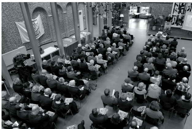
Parochiedag, Op 7 februari ging de Parochiedag over de betekenis van de heilige Laurentius.