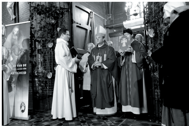
Heilige deur, Op 13 december opende de bisschop de heilige deur in de basiliek in Schiedam.

om op onze beurt heel concreet barmhartigheid te betonen aan onze naaste door werken van barmhartigheid, inclusief het bidden voor hen die gestorven zijn.” Een vrijwilligersgroep van gastvrouwen en gastheren maakt de openstelling van de basiliek in Schiedam mogelijk gedurende het jaar van barmhartigheid.