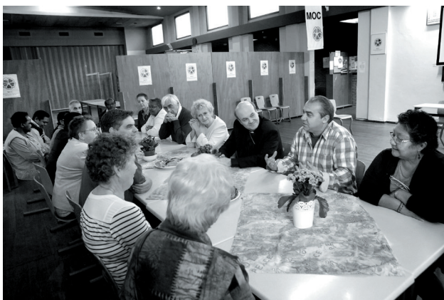
MOC Den Haag, Gesprek bij het Missionair Ontmoetingscentrum in de Schilderswijk op 8 oktober.