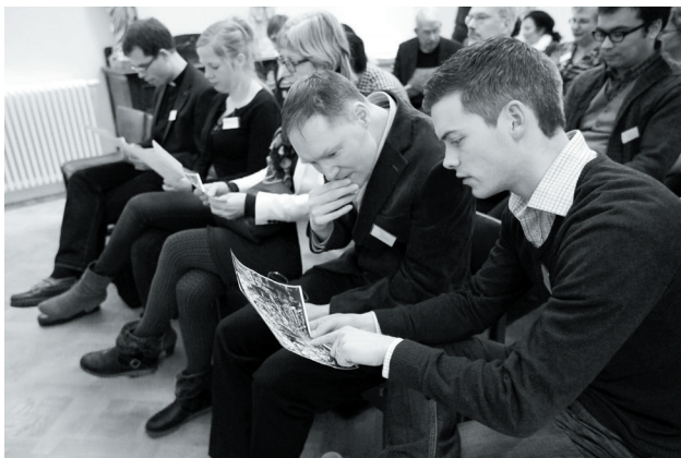
Sjofar, Bijeenkomst van theologiestudenten op 23 januari.