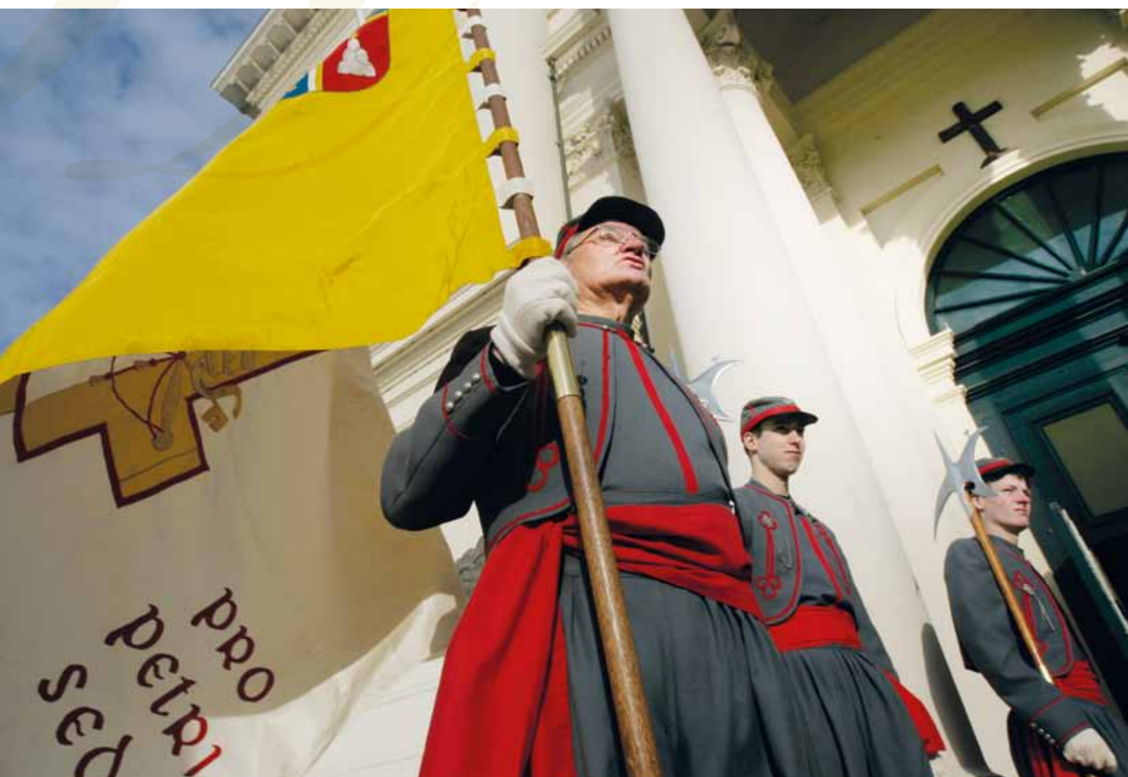
Leden van Pro Petri Sede ('voor de zetel van Petrus') bij de basiliek van Oudenbosch, de 'kleine Sint Pieter'. De vereniging Pro Petri Sede werd in 1871 opgericht als bond van oud-zouaven, strijders die tussen 1860 en 1870 in dienst van paus Pius IX vochten voor de bedreigde kerkelijke staat. Ondanks de steun van de door de paus opgeroepen katholieke jongemannen, waaronder 3200 Nederlandse zouaven, werd Rome in 1871 veroverd door Italiaanse troepen.

Op 29 juni 1868 riep Paus Pius IX (1846-1878) een concilie op voor 1869. Dit concilie zou zoals altijd de naam krijgen van de plaats van samenkomst het Vaticaan, vandaar: het (Eerste) Vaticaans Concilie.