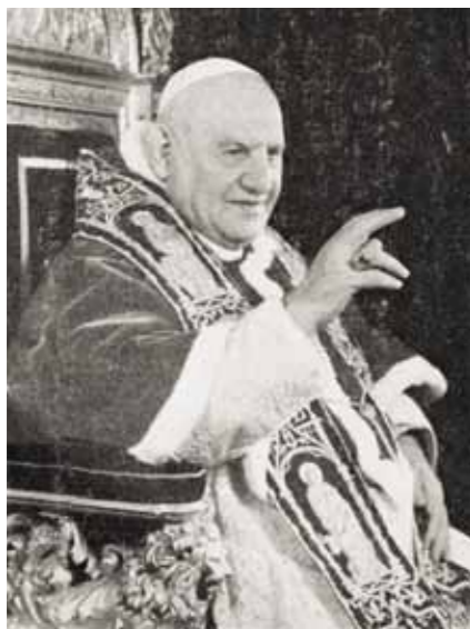
Paus Johannes XXIII