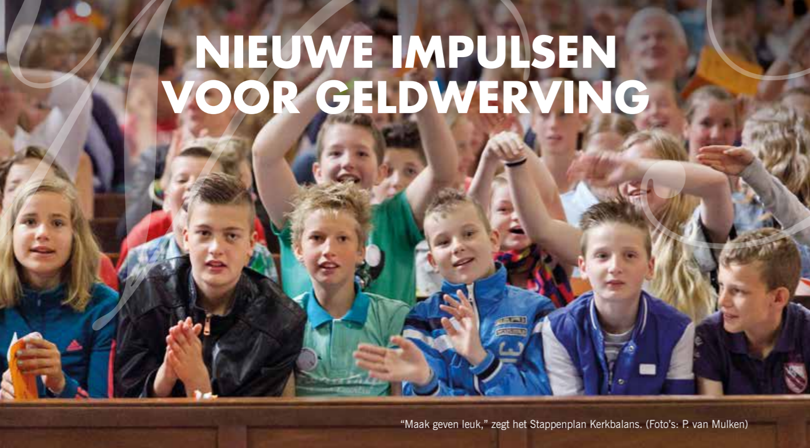
“Maak geven leuk,” zegt het Stappenplan Kerkbalans.