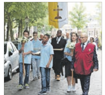
Heilig Hout 15