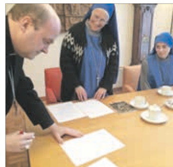
Blauwe Zusters 13