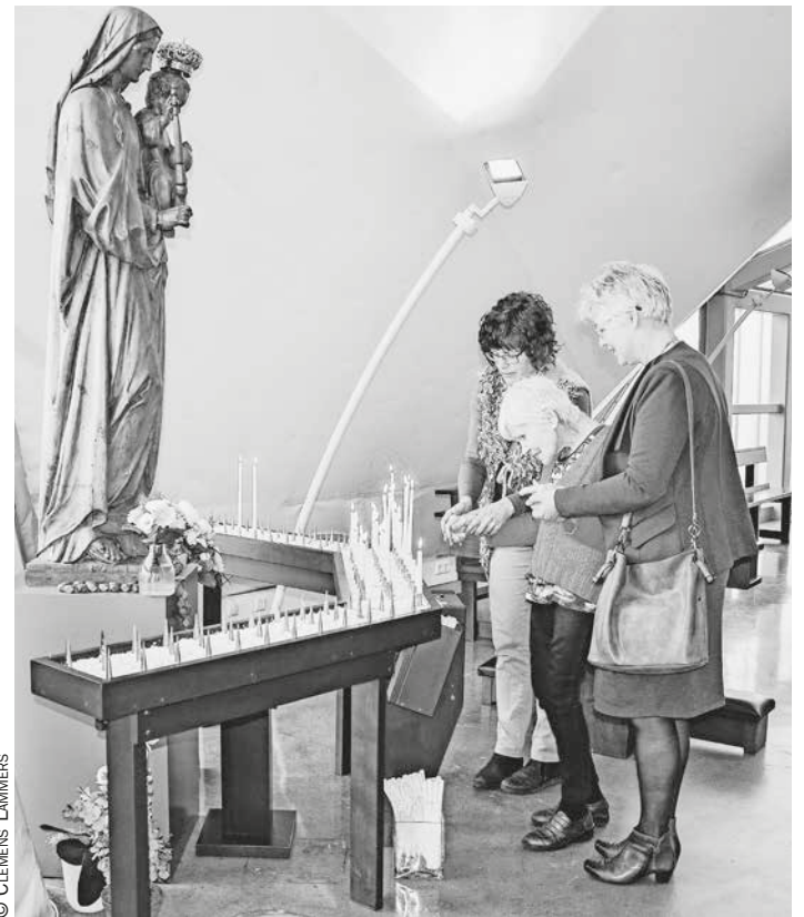
Petrus en Pauluskerk te Maassluis: aandacht voor zieken

In de Petrus en Pauluskerk in Maassluis is het de Elisabethgroep die bijzondere aandacht heeft voor zieken en ouderen. Op 26 april was er een eucharistieviering, speciaal bedoeld voor de zieken en hun familieleden en voor ouderen. Zij ontvingen een persoonlijke uitnodiging. Op 1 mei sloot de parochie de werken van de barmhartigheid af. Op deze dag werd het Liduinafest gevierd, met een eucharistieviering in Liduinabasiliek