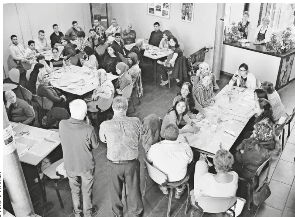
Lucaskerk te Vlaardingen: aandacht voor vluchtelingen