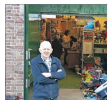
Berkel werkt aan herstel 12-13