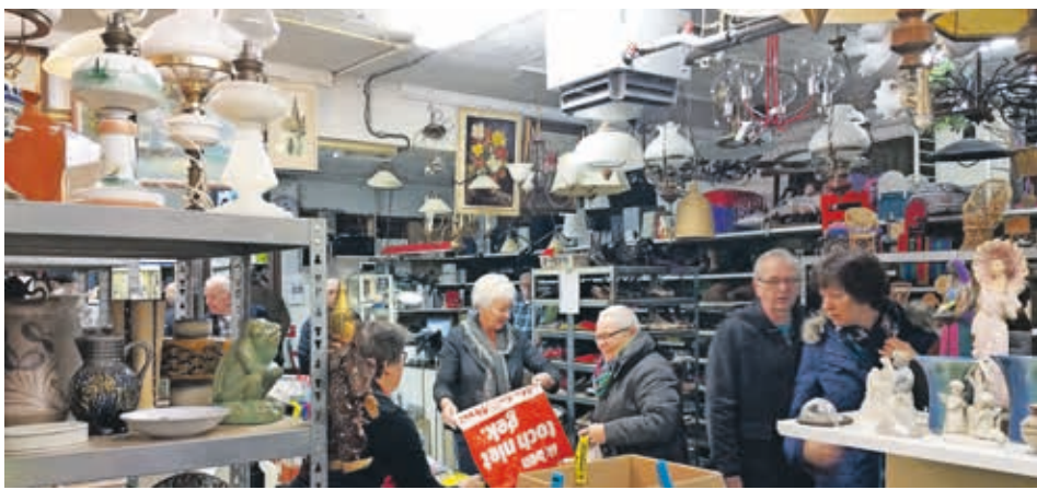
Snuisterijen genoeg in de Paardenstal

Hoe ging dat liedje ook al weer? Amsterdam, die grote stad, die is gebouwd op palen. Als die stad eens ommeviel, wie zou dat betalen? Iets dichterbij, in ons eigen bisdom, kunnen ze daarover meepraten. De Onze Lieve Vrouw Geboortekerk (gemeente Lansingerland, parochie Christus Koning) is ook gebouwd op palen. Maar die palen blijken aangetast door een bacterie, en de kerk zou binnenkort wel eens écht ommevallen. Wie gaat dat dan eigenlijk betalen?