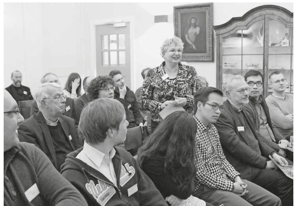
Ontmoeting theologiestudenten van Sjofar