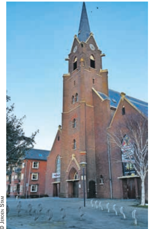
O.L.V. Geboortekerk te Berkel en Rodenrijs

verschillende groepen die te gast zijn. De parochianen treffen elkaar na de vieringen in het parochiehuis. Tientallen bewoners van het naastgelegen verzorgingstehuis Huize Sint Petrus vinden er een warm welkom. De KBO organiseert er maandelijks een gezellige ontmoeting en al gauw zo'n zestig ouderen schuiven dan aan. Men organiseert een jaarlijkse