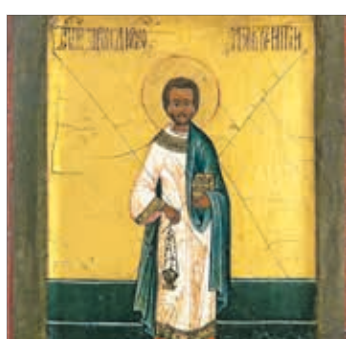
Ogen van geloof 3