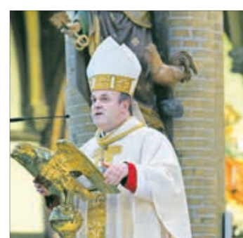
Bisschop stelt acolieten aan 9