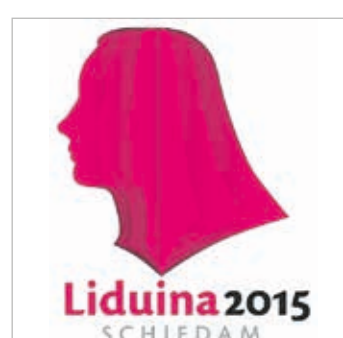
Liduina centraal 6