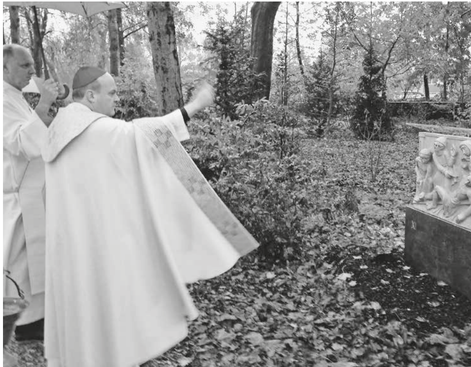
Inzegening kruiswegstaties in Langeraar