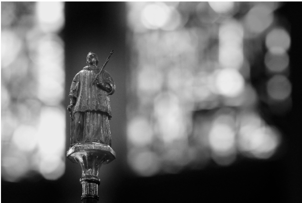
Laurentiusconferentie. Gesprekken over de betekenis van het katholiek sociaal denken.