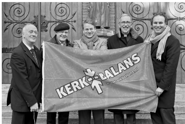
Kerkbalans. De actie wordt ingeluid met een startbijeenkoms.