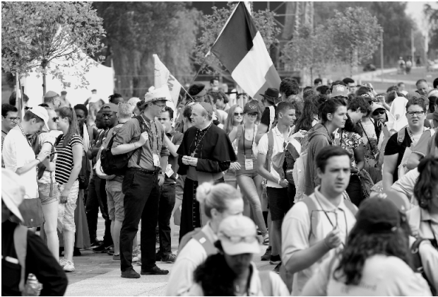
Wereldjongerendagen. De WJD waren een hoogtepunt in het heilig jaar van de barmhartigheid.

ontdekken wat God voor ons in petto heeft, onze roeping. Verbonden met elkaar in vriendschap in een netwerk van liefde, op school, thuis, op sport, of waar je ook mag zijn. Misschien je voorbereidend op een huwelijk, of op een binding aan de Kerk als priester, diaken of religieus. God roept jullie, antwoord in alle oprechtheid. Eén ding wens ik jullie nog aan het eind van deze reis. Ga ook met heel veel zelfvertrouwen. We mogen in goed vertrouwen op weg gaan. Zelfstandige mensen, stevig staand in het geloof in Christus en zo instrument in Gods handen. Ga die weg en beschouw dit alles als een vrucht van deze reis. Voor vandaag, voor morgen, voor alle dagen van je leven.”