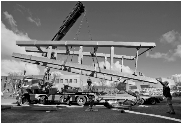
Nieuwe klokkentoren. Op 4 juni luiden in Brielle de eerste keer de klokken in de nieuwe klokkentoren.