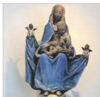
Maria oktobermaand 6