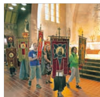
Nationale bedevaart 8